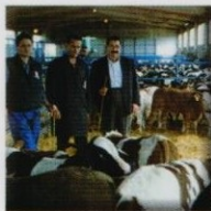
CENTRO DE IMPORTACIÓN IMPORT CENTRE CENTRE D'IMPORTATION