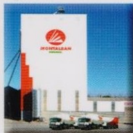
FÁBRICA PIENSOS ANIMAL FEEDS PLANT FABRIQUE D'ALIMENTS POUR BETAIL