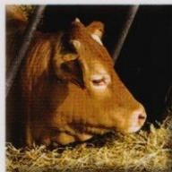
ENGORDE GANADO LIVESTOCK FATTENING ENGRASSEMENT DE BETAIL