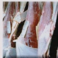
CANALES VACUNO CATTLE CARCASSES CARCASSES DE BOVIN