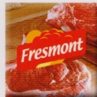
MARCA REGISTRADA REGISTERED TRADEMARK MARQUE DÉPOSÉE