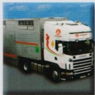
TRANSPORTE TRANSPORTE TRANSPORTE