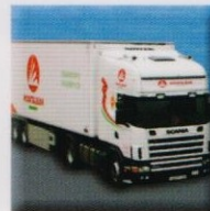
TRANSPORTE FRIGORÍFICO REFRIGERATED TRANSPORT TRANSPORT FRIGORIFIQUE